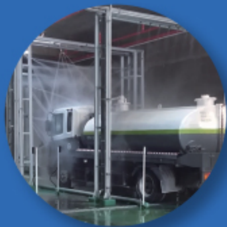
• ENTRA ELV-2000 (대형)