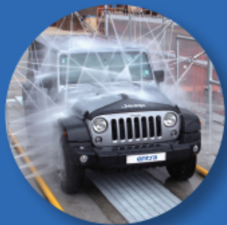
• ENTRA ESV-2000 (소형)